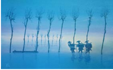
「風強き日に」画 渡部 等